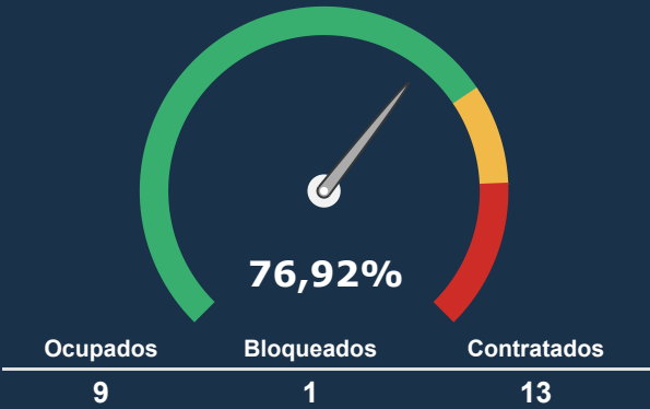
UTI ADULTA *