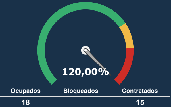
INTERNAÇÃO PSIQUIATRICA *