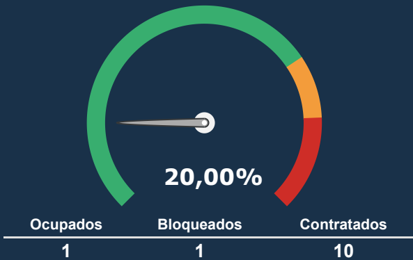
INTERNAÇÃO PEDIATRIA *