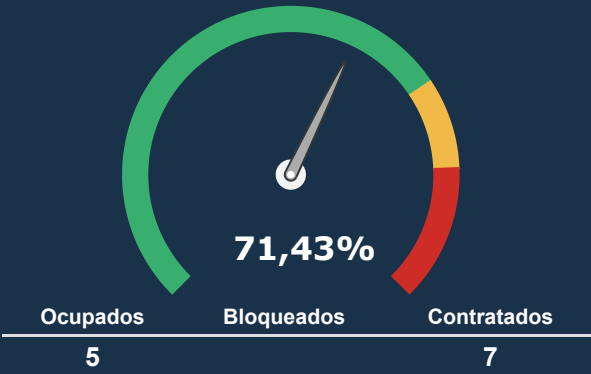
UTI PEDIATRICA *