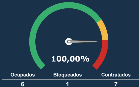
UTI NEONATAL *