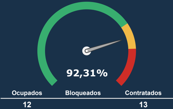
UTI ADULTA *