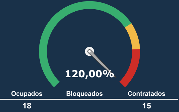
INTERNAÇÃO PSIQUIATRICA *