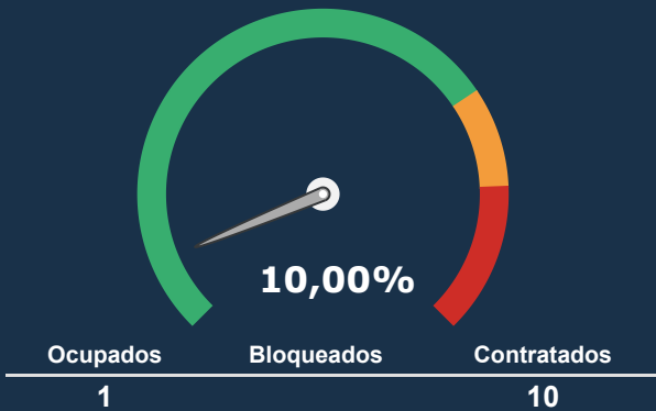
INTERNAÇÃO PEDIATRIA *