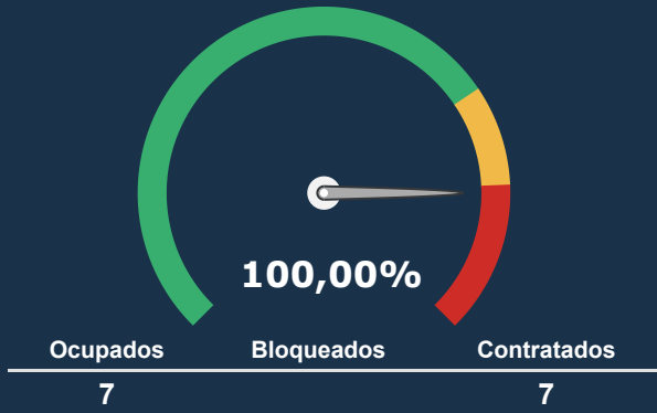
UTI NEONATAL *