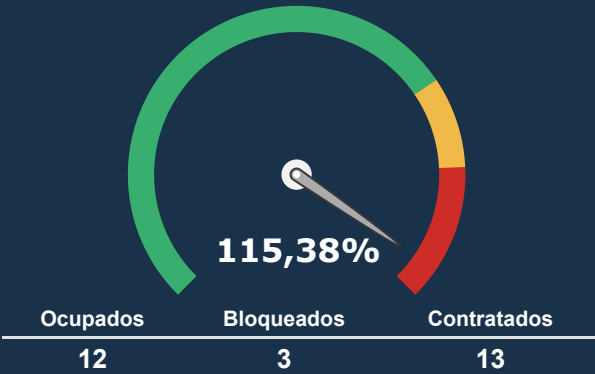
UTI ADULTA *