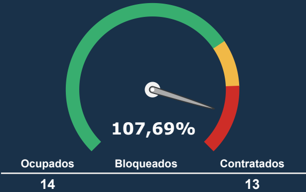
UTI ADULTA *