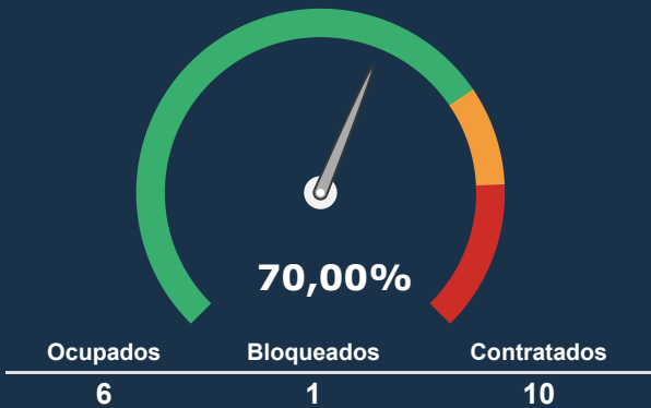
INTERNAÇÃO PEDIATRIA *