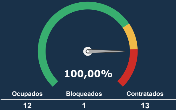
UTI ADULTA *