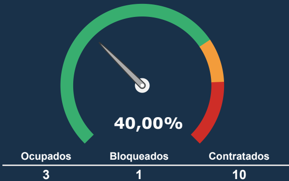
INTERNAÇÃO PEDIATRIA *