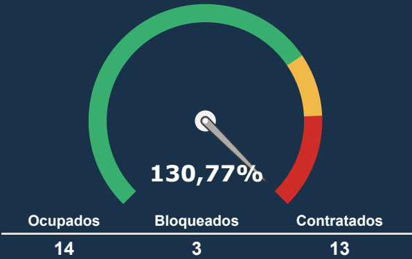
UTI ADULTA *