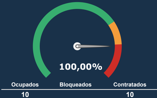
INTERNAÇÃO PEDIATRIA *