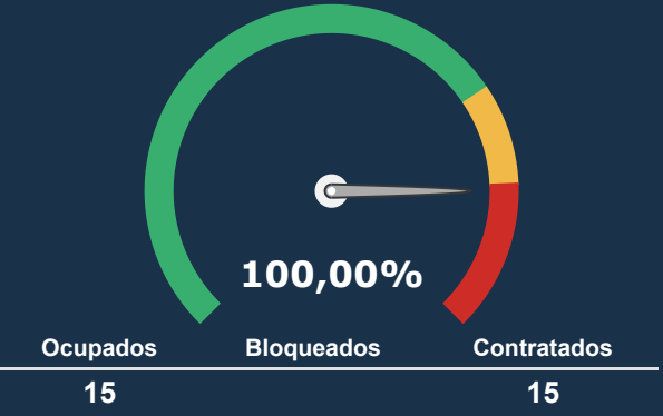
INTERNAÇÃO PSIQUIATRICA *