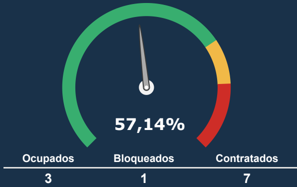
UTI NEONATAL *