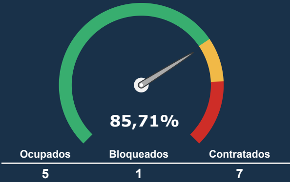
UTI NEONATAL *