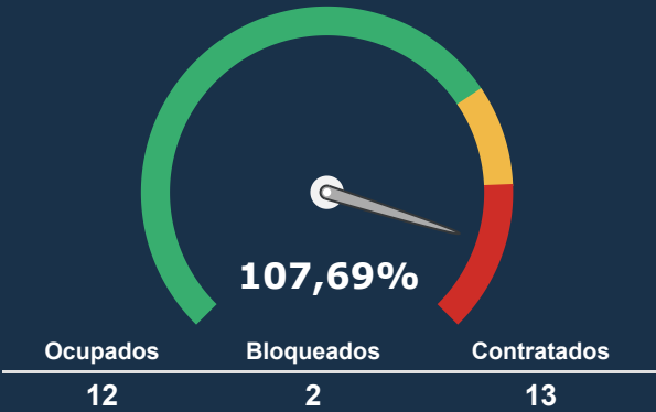
UTI ADULTA *