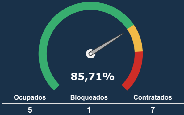
UTI NEONATAL *