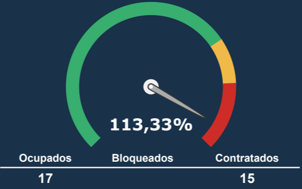
INTERNAÇÃO PSIQUIATRICA *