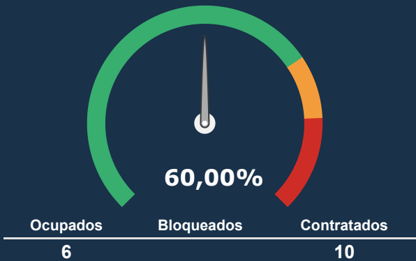
INTERNAÇÃO PEDIATRIA *