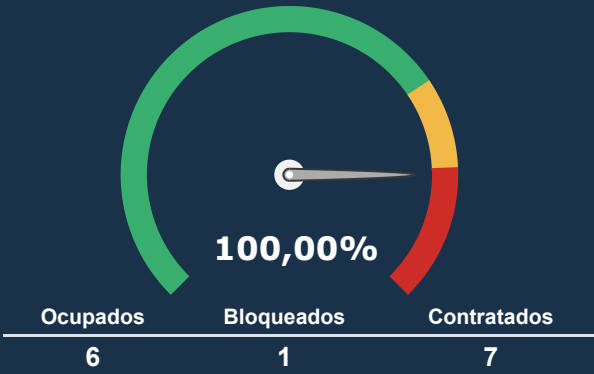
UTI NEONATAL *